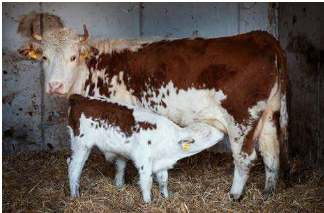
Jedes Jahr ein gesundes, vitales Kalb: Die Grundlage erfolgreicher Mutterkuhhaltung. Egal um welche Rasse es geht, ob intensive oder extensive Produktion. Erfreulicherweise hat sich die Totgeburtenrate im Vergleich zum Vorjahr verbessert.