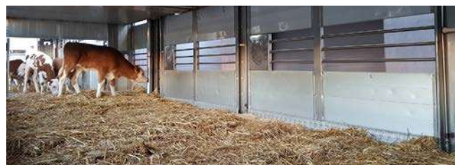
Kälbertransport von Salzburg über Bozen nach Spanien.

Die EuRH-Analyse soll Daten für die bevorstehende Überarbeitung der Tierschutzvorschriften der EU liefern. Bis Ende dieses Jahres sollen neue und EU-weit geltende Regeln für den Transport von Lebentieren präsentiert werden.