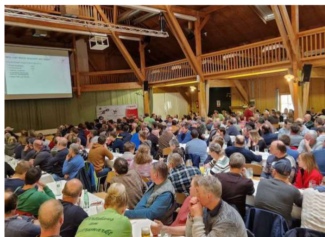
Volles Haus in der Bauernmarkthalle Ried im Innkreis, OÖ

Ausführlicher Bericht unter https://www.besamungsstation.at/