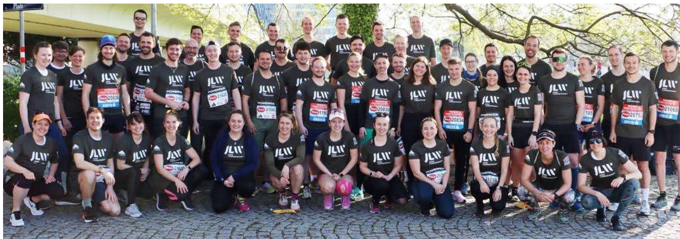
Die Läufer:innen der Jungen Landwirtschaft (JLW) beim gemeinsamen Gruppenfoto vor dem Start. Mit dabei acht Läufer:innen aus dem Haus der Tierzucht in Wien, die sich für den gemeinsamen Social Media Auftritt Stadt Land Tier ins Zeug legten.